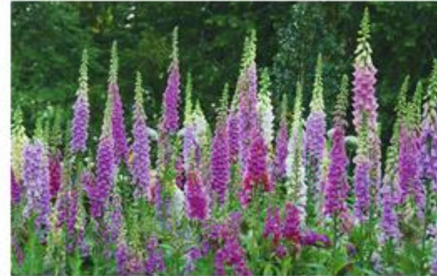
Bloemstengels en bloemen in het tweede jaar