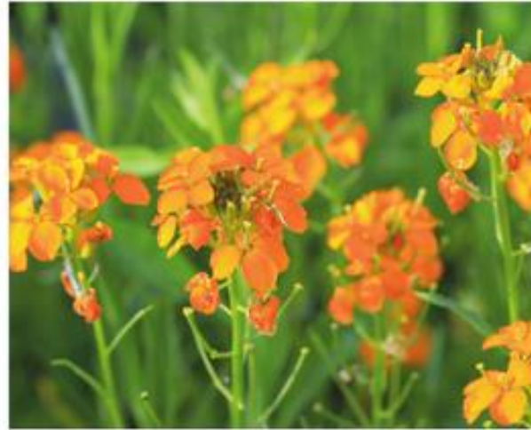
De bloemen van de kortlevende muurbloem