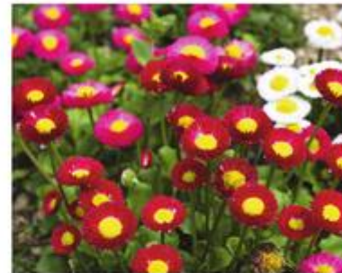
Variëteiten in vele bloeikleuren