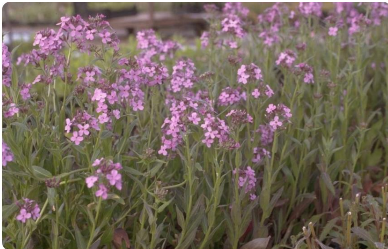
Damastbloem - Hesperis matronalis