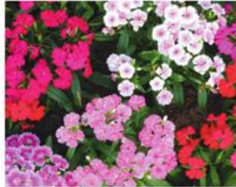
Bloemen in vele kleuren