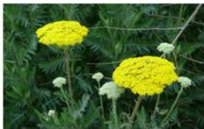
Gele bloemen in juni-juli