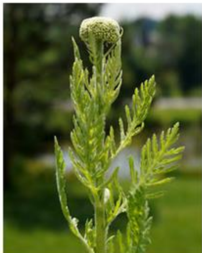
Duizendblad in knop