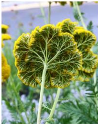
Aan draden tezamen hangend