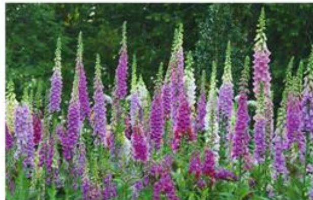
Bloemstengels en bloemen in het tweede jaar