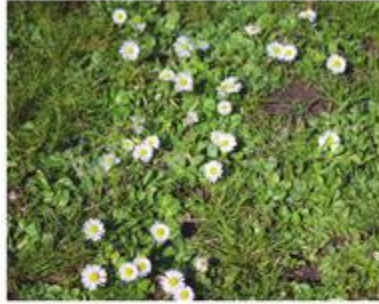
Bellis perennis komt van nature in Nederland voor