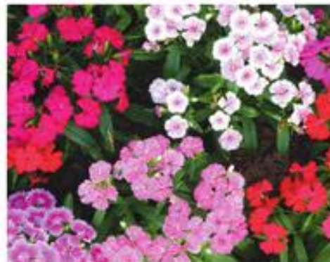
Bloemen in vele kleuren