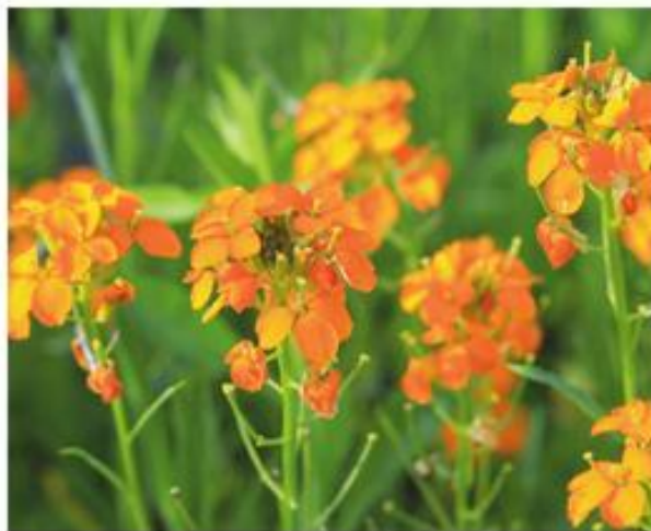
De bloemen van de kortlevende muurbloem