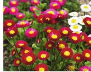
Variëteiten in vele bloeikleuren

https://www.vdberk.nl/bomen/pyrus-communis-beech-hill/